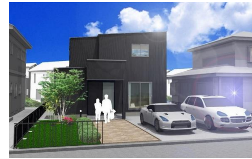
※パース画像はイメージです。