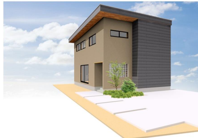
※パース画像はイメージです